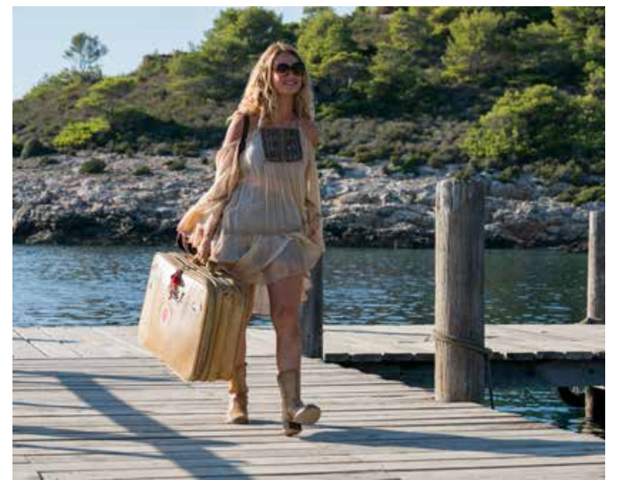
Den nye «Mamma Mia!»-filmen var årets publikumfavoritt i Norge, i hvert fall hvis vi skal dømme ut fra billettsalget.

I romjulen ble stavangerkvintettens plate nummer tre og fire, «One Eye Open» og «Hugger-Mugger» fra 1993 og 1994, sluppet på vinyl.