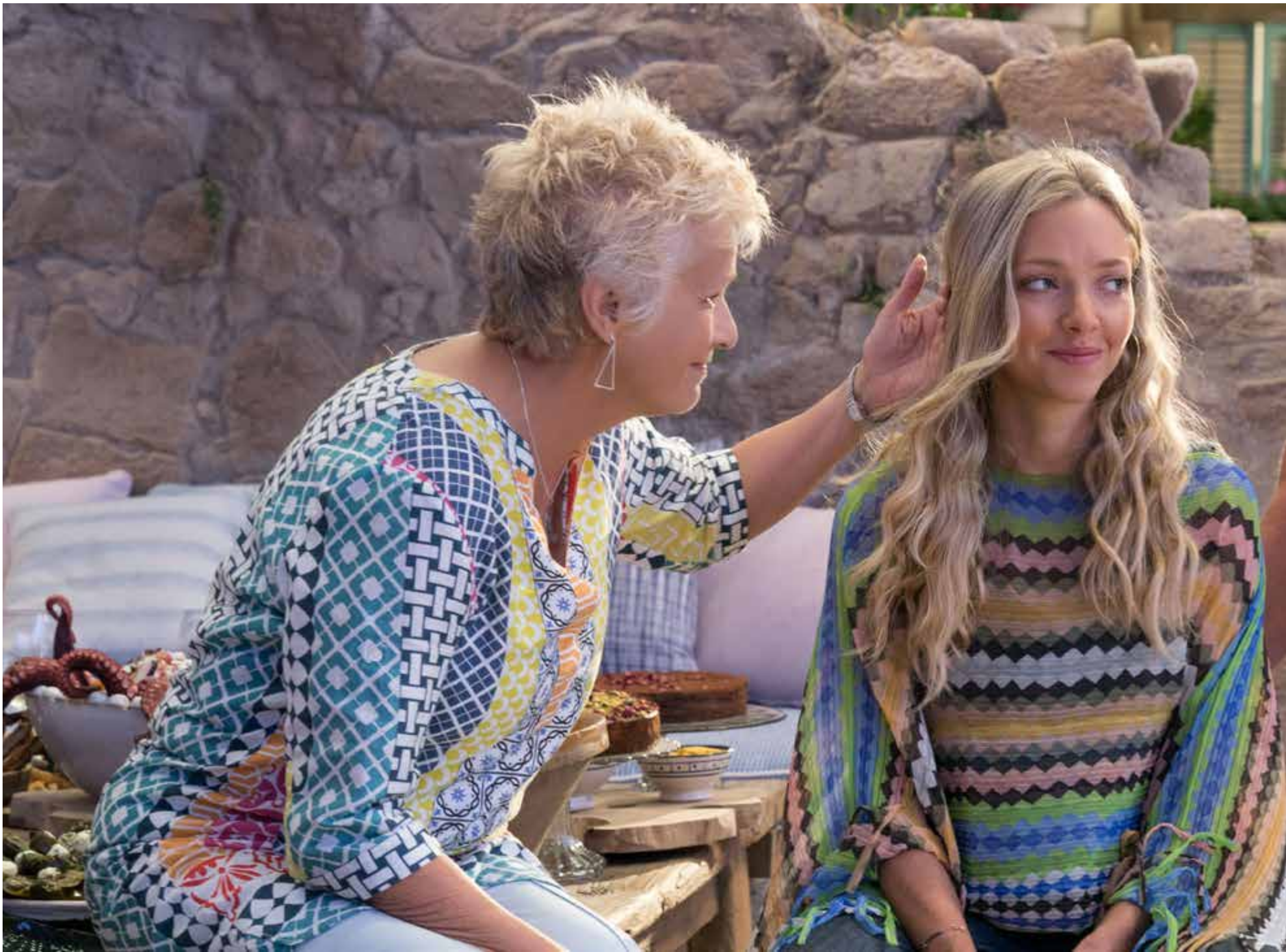
ABBA: Fjorårets «Mamma Mia»-film fylte 57.000 seter på Bergen kino.

KINOBESØK // På to år er 200.000 kinopublikummere forsvunnet, men «Mamma Mia» bremset fjorårets fall.