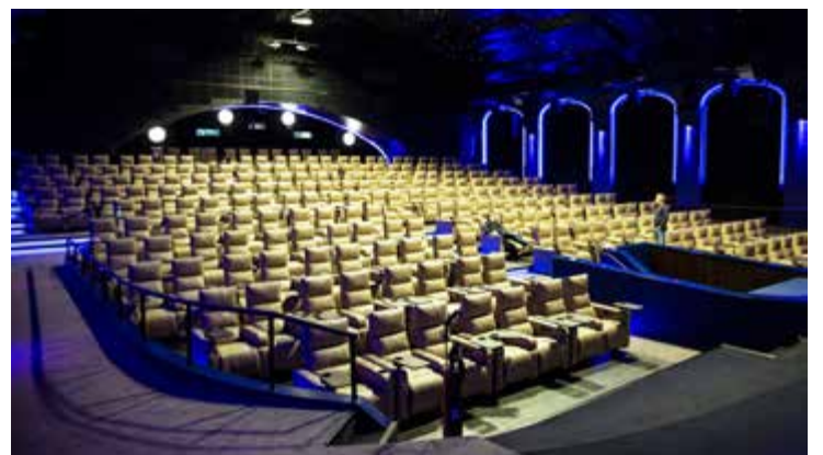
KOMFORT: Kinoene i Bergen og på Lagunen vil konkurrere om å ha best komfort. Her fra KP1.